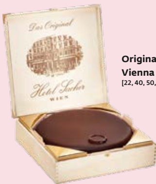
Original Sacher-Torte Vienna Duty Free [22, 40, 50, 61] Plaza, Gates C & D