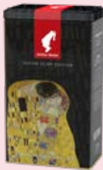
Julius Meinl Kaffee Julius Meinl coffee Vienna Duty Free [22, 40, 50, 61] Plaza, Gates C & D