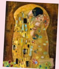
Poster "Der Kuss" (Gustav Klimt) "The Kiss" poster (Gustav Klimt)