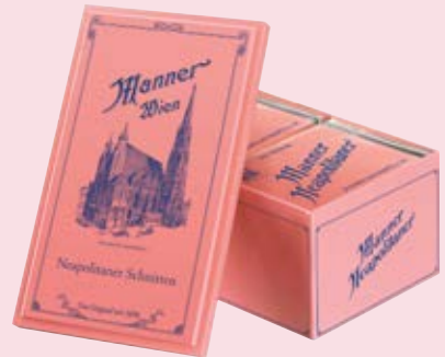
Manner Nostalgie Dose Manner nostalgia box Vienna Duty Free [22, 40, 50, 61] Plaza, Gates C & D