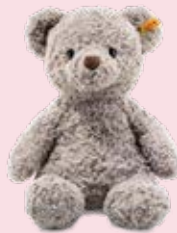
Kuscheltier Stuffed animal