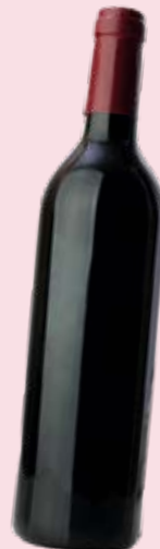
Wein aus Österreich Austrian wine Senses of Austria [23, 42] Plaza, Gates C